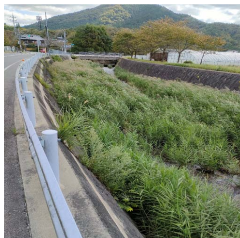
畑野町土ヶ畑営農センター手前50mから20m部分の側溝に蓋を設置