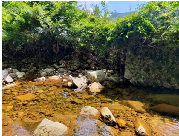
この範囲の大路次川の浚渫