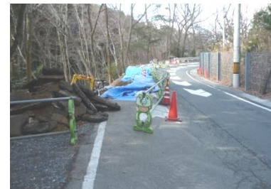
(府道54号/路肩崩落の復旧工事)

新型コロナウイルス感染症 拡大防止の行動を 新型コロナウイルス感染症の急激な感染拡大を受け、亀岡市も含む京都府下全域に緊急事態措置が、現在も継続して実施されています。 医療機関への通院、食品や生活必需品の買い出し、必要な職場への出勤、野外での運動や散歩など生活や健康維持のために必要な場合を除き、原則として外出しないようにしましょう。 特に、午後八時以降の不要不急の外出自粛を徹底してください。 一人ひとりの理解と行動が、今の感染拡大を抑えるために求められています。ご自身やご家族、大切な方の命を守るために、ご理解と行動をお願いします。 もし発熱等の症状がある場合は、必ず電話でかかりつけ医に相談するか「きょうと新型コロナ医療相談センター」へ問い合わせ、指示に従って検査、診療をしてください。