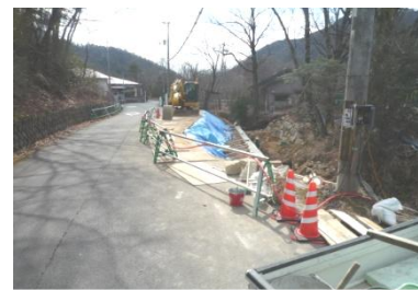
(普通河川 砂川/護岸の復旧工事)

【復旧工事施工箇所】 ○道路関係 十三箇所(府道・市道) ○河川関係 四八箇所(一級・砂防・普通) ○農地関係 二十箇所(農道・水路・農地)